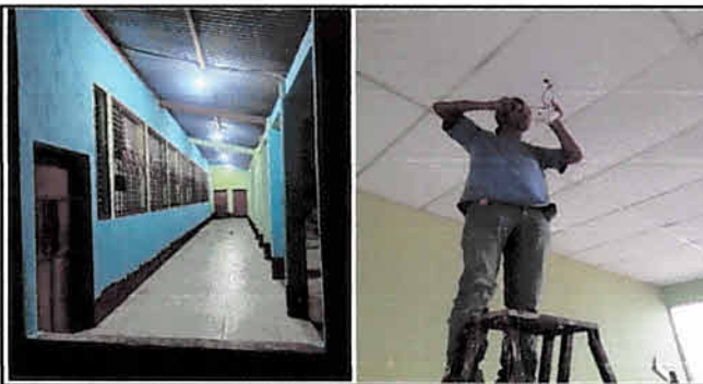
Reparación de sistema eléctrico.