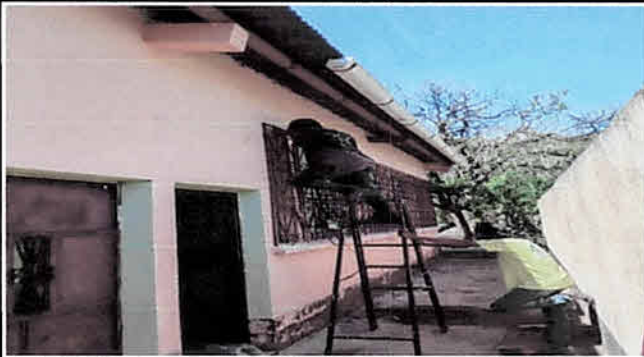
Instalación de Balcones, sustitución de Canal para agua pluvial.