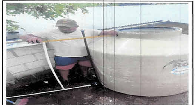
Drenaje para agua pluvial y torta de concreto.