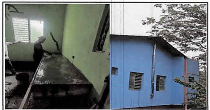
Fabricación de Mesón, Sustitución de Piso, Estufa Rural.

Observación: Si es necesario se pueden agregar hojas adicionales y actualizar el número de hojas.