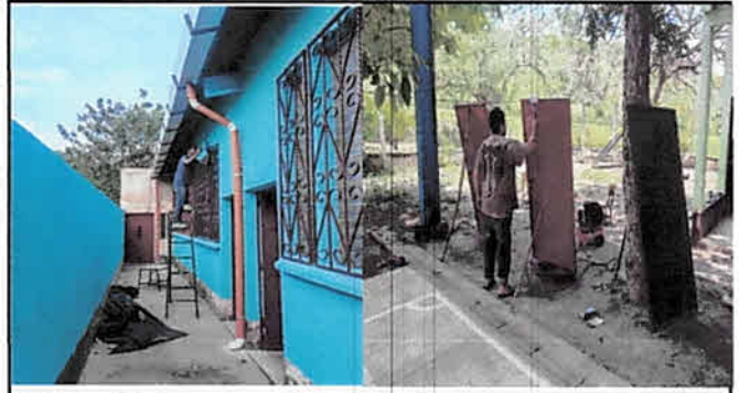
Mantenimiento de Puertas y Balcones.